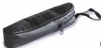
Étui en cuir ORA-A2103