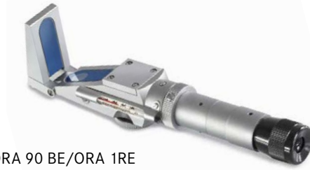
ORA 90 BE/ORA 1RE