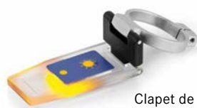
Clapet de prisme avec LED ORA-A1101